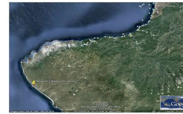
Eye altitude 50 km