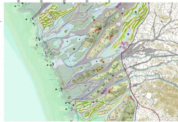
Zonning and Activity corridors

Design approach: ECOLOGICAL URBANISM Conceptual project statement: BOUTIQUE VILLAGE Qualitative differentiation