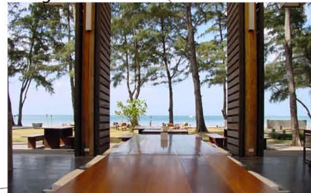
Bar and restaurants