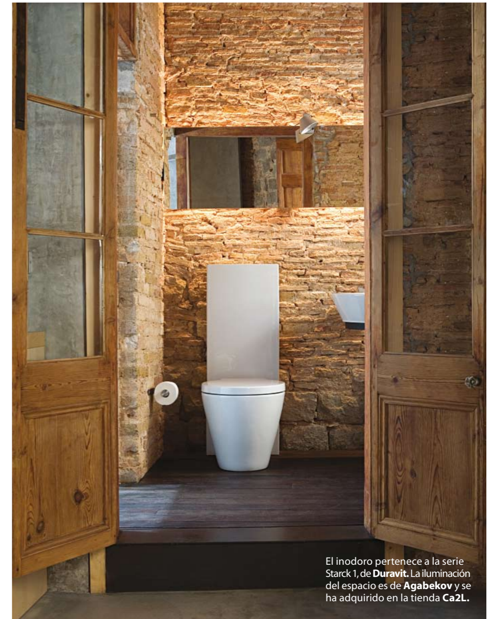
El inodoro pertenece a la serie Starck 1, de Duravit. La iluminación del espacio es de Agabekov y se ha adquirido en la tienda Ca2L.