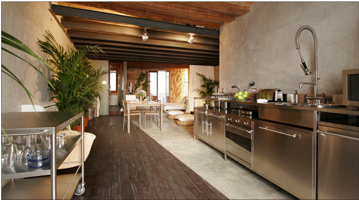
(บนซ้าย) การออกแบบที่ผสมผสานระหว่างวัสดุเก่าและใหม่ทำให้บรรยากาศของห้องนำดูกลมกลืนกับบริบทรอบข้าง (ล่าง) ชุดเครื่องครัวสแตนเลส 'Inox finishing' เป็นเหมือนตัวกลางที่จะผสมผสานความแตกต่างของวัสดุ

นอกจากนี้แล้วสถาปนิกทั้งสองยังทำหน้าที่เข้ามาเก็บกวาดห้องพักแห่งนี้เองหลังจากที่ผู้อาศัยชั่วคราวได้กลับไปแล้ว เพราะนั่นหมายถึงการเข้าเก็บข้อมูลพฤติกรรมความเป็นอยู่ของผู้คนในปัจจุบัน ซึ่งมีจะสะท้อนวัฒนธรรมการบริโภคร่วมสมัยได้อย่างมหาศาลผ่านกองขยะหรือสิ่งของเหลือใช้ที่ถูกปล่อยให้เขาไว้ และข้อมูลเหล่านี้ก็จะถูกนำมาศึกษาต่อการออกแบบเพื่อการอยู่อาศัยของสถาปนิกทั้งสองต่อไป